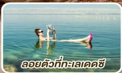
ลอยตัวที่ทะเลเดดซี