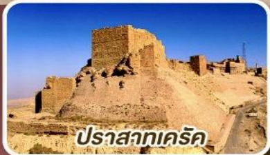
ปราสาทเคิร์ก