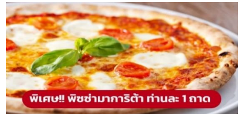
พิเศษ!! พิซซ่ามาการิตต้า ท่านละ 1 ถาด

นำท่านเก็บภาพความประทับใจและถ่ายรูป 1 ใน 7 สิ่งมหัศจรรย์ของโลก หอเอนปีซ่า (Leaning Tower of Pisa) หอเอนปีซ่าที่สร้างขึ้นเพื่อเป็นหอรชงแห่งวิหารประจำเมือง แต่เพียงการเริ่มต้นของการสร้างถึงบริเวณชั้น 3 ก็เกิดการทรุดตัวและต้องหยุดการก่อสร้างจนถัดมาอีก 100 ปี ถึงได้สร้างต่อจนเสร็จสมบูรณ์ มหาวิหารปีซ่า (Cathedral of Pisa) มหาวิหารที่สวยงามที่สุดในลักษณะโรมันเนสส์ แสดงให้เห็นจากชายหอคีลุ่ม กลางตัวมหาวิหาร และชาวหอรชง ตัวมหาวิหารเป็นผังกางเขน มีมุขท้ายวัดและตกแต่งซุ้มโค้งรอบวัดภายนอกเป็นแบบแถบหินอ่อน สลับสีทางขวาง ซึ่งกลายมาเป็นแบบที่เรียกว่า "ลักษณะปีซ่า" และโดมรูปไข่และ Pisa Baptisty of St. John เป็นอาคารทางศาสนาคริสต์นิกายโรมันคาทอลิก จากนั้นนำท่านเดินทางสู่ เมืองมิลาน (Milan) (ระยะทาง 282 กม. / 4 ชั่วโมง)