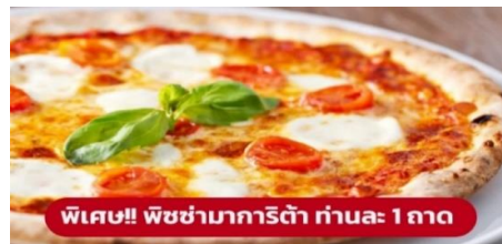
พิเศษ!! พิซซ่ามาการิตต้า ท่านละ 1 ถาด

นำท่านเก็บภาพความประทับใจและถ่ายรูป 1 ใน 7 สิ่งมหัศจรรย์ของโลก หอเอนปิซ่า (Leaning Tower of Pisa) หอเอนปิซ่าที่สร้างขึ้นเพื่อเป็นหอรชังแห่งวิหารประจำเมือง แต่เพียงการเริ่มต้นของการสร้างถึงบริเวณชั้น 3 ก็เกิดการทรุดตัวและต้องหยุดการก่อสร้างจนถัดมาอีก 100 ปี ถึงได้สร้างต่อจนเสร็จสมบูรณ์ มหาวิหารปิซ่า (Cathedral of Pisa) มหาวิหารที่สวยงามที่สุดในลักษณะโรมันเนสส์ แสดงให้เห็นจากชายหอคีลุ่ม กลางตัวมหาวิหาร และขวหอรชัง ตัวมหาวิหารเป็นผังกางเขน มีมุขท้ายวัดและตกแต่งซุ้มโค้งรอบวัดภายนอกเป็นแบบแถบหินอ่อน สลับสีทางขวาง ซึ่งกลายมาเป็นแบบที่เรียกว่า "ลักษณะปิซ่า" และโดมรูปไข่และ Pisa Baptisty of St. John เป็นอาคารทางศาสนาคริสต์นิกายโรมันคาทอลิก จากนั้นนำท่านเดินทางสู่ เมืองมิลาน (Milan) (ระยะทาง 282 กม. / 4 ชั่วโมง)