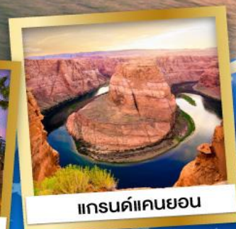
แกรนด์แคนยอน