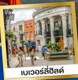
เบเวอรี่ฮิลล์