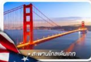
สะพานโกลเดนเกต

★ เยือนอุทยานแกรนด์แคนยอน ฝั่ง South rim ความมหัศจรรย์ทางธรรมชาติ ที่ยิ่งใหญ่ที่สุดแห่งหนึ่งของโลก