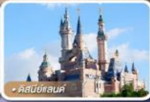
คัสตีย์แลนด์