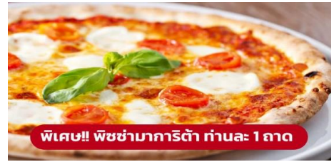
พิเศษ!! พิซซ่ามารีต้า ท่านละ 1 ถาด

ที่พัก: Novotel Venice Mestre Castellana หรือระดับใกล้เคียงกัน (ชื่อโรงแรมที่ท่านพักทางบริษัทจะทำการแจ้งพร้อมใบนัดหมาย 5-7 วัน ก่อนวันเดินทาง)