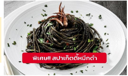
พิเศษ!! สปาเก็ตตีหมีกดำ

Highlight ! เมื่อเยือนเกาะเวนิส เมนูที่ขึ้นชื่อและหากได้มาต้องได้ลิ้มลอง สปาเก็ตตีพุดซอสหมีกดำที่คลุกเคล้ากับความหอมนุ่มนวลกับบรรยากาศ สุดคลาสสิคฉบับอิตาลีแสนต้นตำรับเวนิส