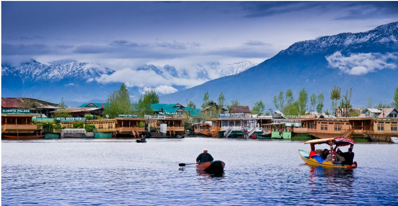
ล้อมโดยรอบ ในสมัยที่ถูกปกครองโดยราชวงศ์โมกุล มีการจัดทำผังเมืองขึ้นมาใหม่ จึงทำให้แคชเมียร์เป็น

เช้า บริการอาหาร ณ ห้องอาหารของโรงแรม 07.40 ออกเดินทางสู่ ท่าอากาศยานศรีนาคา เมืองแคชเมียร์ ประเทศอินเดีย โดยสายการบิน INDIGO เที่ยวบินที่ 6E 5201 09.10 เดินทางถึง ท่าอากาศยานศรีนาคา รัฐแคชเมียร์ ประเทศอินเดีย หลังผ่านขั้นตอนการตรวจหนังสือเดินทาง และตรวจรับสัมภาระเรียบร้อยแล้ว นำท่านสู่ตัว เมืองศรีนาคา (SRINAGAR) ซึ่งเป็นเมืองหลวงของแคชเมียร์ ประกอบด้วยทะเลสาบขนาดใหญ่ คือ ทะเลสาบดาล และ ทะเลสาบนากิน ด้านหลังมีเทือกเขาโอบ