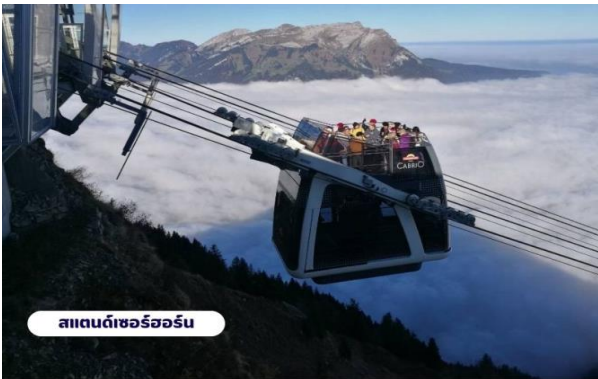
สแตนด์เซอร์ฮอร์น

เช้า บริการอาหารเช้า ณ ห้องอาหารของโรงแรม จากนั้นนำท่านเดินทางสู่สถานีกระเช้า เพื่อเตรียมตัวเดินทางขึ้นสู่ ยอดเขาสแตนเซอร์ฮอร์น (Mt.Stanserhorn) มีความสูงที่ 1,898 เมตร(6,227 ฟุต) ระหว่างทางคุณจะได้ชมวิวแบบพาโนรามาและให้ท่านได้สัมผัสการเดินทางโดยขึ้นกระเช้า “Cabrio” กระเช้าลอยฟ้าเปิดประทุนที่มี 2 ชั้นแห่งแรกของโลก และสามารถจุผู้โดยสารได้เกือบ 60 ท่าน โดยขึ้นดาดฟ้าจะสามารถจุได้ 30 ท่าน ระยะเกือบ 2 กิโลเมตร ระหว่างทางขึ้นสู่ยอดเขาท่านจะสามารถมองเห็นวิวแบบ 360 องศา จากนั้นให้ท่านได้เพลิดเพลินกับความสวยงามของธรรมชาติและทัศนียภาพที่งดงาม