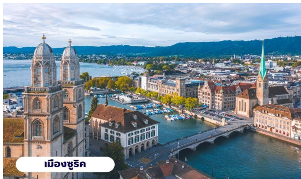
เมืองซูริค

เที่ยง บริการอาหารกลางวัน ณ ภัตตาคาร จากนั้นนำท่านลงจากยอดเขาและเดินทางต่อไปยัง เมืองซูริค ใช้เวลาเดินทางประมาณ 1 ชั่วโมง นำท่านเที่ยวชม จัตุรัสพาราเดพลาทซ์ (Paradeplatz) จัตุรัสเก่าแก่ที่มีมาตั้งแต่สมัยศตวรรษที่ 17 ในอดีตเคยเป็นศูนย์กลางของการค้าสัตว์ที่สำคัญของเมืองซูริค ปัจจุบันจัตุรัสนี้ได้กลายเป็นชุมทางรถรางที่สำคัญของเมืองและยังเป็นศูนย์กลางการค้าของย่านธุรกิจ ธนาคาร สถาบันการเงินที่ใหญ่ที่สุดในประเทศ สวิตเซอร์แลนด์ นำท่านแวะถ่ายรูปกับ โบสถ์ฟรอมุนสเตอร์ (Fraumunster Abbey) จากบนสะพานมุนสเตอร์บรูค เป็นโบสถ์ที่มีชื่อเสียงของเมืองซูริค สร้างขึ้นในปี ค.ศ. 853 โดยกษัตริย์เยอรมันหลุยส์ ใช้เป็นสำนักแม่ชีที่มีกลุ่มหญิงสาวชนชั้นสูงจากทางตอนใต้ของเยอรมันอาศัยอยู่ นำท่านสู่ ถนนบาห์นโฮฟชตราสเซอร์