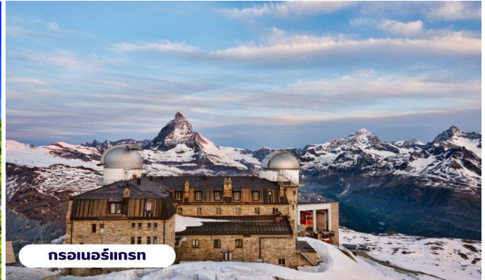
กรอเนอร์กรัท