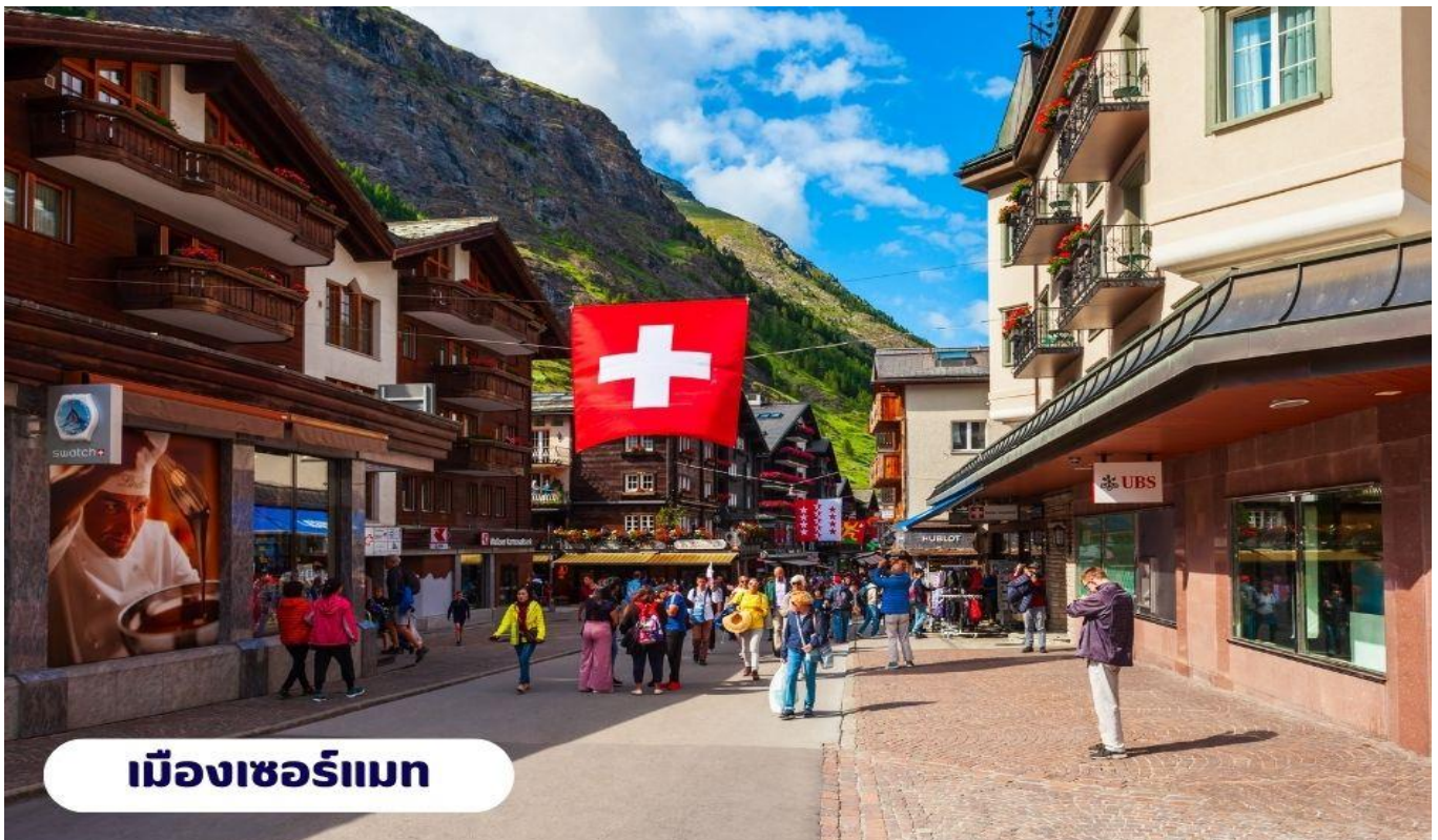
เมืองเซอร์แมท

📍 บริการอาหารเช้า ณ ห้องอาหารของโรงแรม จากนั้นนำท่านเดินทางสู่ เมืองแทสซ์ (Tasch) ใช้เวลาเดินทางประมาณ 2.30 ชั่วโมง ตั้งอยู่ในประเทศสวิตเซอร์แลนด์ เป็นประเทศขนาดเล็กที่ไม่มีทางออกสู่ทะเล และตั้งอยู่ในทวีปยุโรปตะวันตก ซึ่งมีเทือกเขาแอลป์ ซึ่งเป็นเทือกเขาที่ใหญ่ที่สุดของทวีปยุโรป เลาะเลียบตามหุบเขา ชมทิวทัศน์สวยอันงดงามตลอดเส้นทาง จากนั้นนำท่านเดินทางโดยรถไฟสู่เมืองเซอร์แมท (Zermatt) ใช้เวลาเดินทางประมาณ 15 นาที โดยรถไฟซึ่งเป็นเมืองที่ไม่อนุญาตให้รถยนต์วิ่งและเป็นเมืองที่ได้รับการยกย่องว่าปลอดภัยที่สุดในโลกตั้งอยู่บนความสูงกว่า 1,620 เมตร ซึ่งเป็นที่ตั้งของยอดเขาแมทเทอร์ฮอร์น ซึ่งเป็นสัญลักษณ์ของสวิตเซอร์แลนด์ เมืองเซอร์แมทเป็นเมืองเล็กๆ หรืออาจจะเรียกได้ว่าเป็นหมู่บ้านก็ได้ เพราะว่ามีประชากรในเมืองไม่ถึง 10,000 คน ทางตอนใต้ของสวิตติดกับชายแดนอิตาลี โดยมี Pennine Alps ซึ่งเป็นส่วนหนึ่งของเทือกเขา Alps เป็นเส้นกั้นระหว่าง 2 ประเทศหากพูดถึง Zermatt ก็ต้องนึกถึงยอดเขาแหลมที่มีลักษณะคล้ายปิรามิด ชื่อว่า Matterhorn ที่ตั้งตระหง่านอยู่ใกล้ๆ เมือง มีความสูงถึง 4,478 เมตร สามารถมองเห็นได้จากแทบทุกมุมของเมือง ซึ่ง Matterhorn นี้ถือเป็นสัญลักษณ์ที่สำคัญของ Zermatt