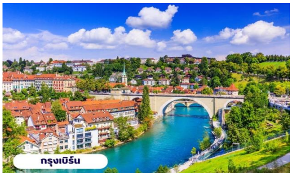
กรุงเบิร์น

ย่านที่ปลอดภัยนึ่ง จึงเหมาะกับการเดินเที่ยวชมอาคารเก่า อายุ 200-300 ปี นำท่านลัดเลาะชมถนนจุงเคอร์นกาสเซ ถนนที่มีระดับสูงสุดของเมืองนี้ ซึ่งเต็มไปด้วยร้านภาพวาดและร้านขายของเก่าในอาคารโบราณ ชมนาฬิกาไข้ท์คล็อคเค้นทรีม อายุ 800 ปี ที่มีโซวีให้ดูทุกๆชั่วโมงในการตีบอกเวลาแต่ละครั้ง หอนาฬิกานี้ ในช่วงปี ค.ศ. 1191-1256 ใช้เป็นประตูเมืองแห่งแรก ภายหลังได้ดัดแปลงไข้ท์คล็อคเค้นทรีมให้กลายเป็นหอนาฬิกา พร้อมติดตั้งนาฬิกาดาราศาสตร์เข้าไป จากนั้นอิสระให้ท่านเดินเล่นและเก็บภาพตามอัธยาศัยหรือจะเลือกช้อปปิ้งซื้อสินค้าแบรนด์เนมและช็อคโกแลตที่ระลึก