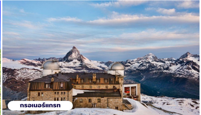
กรอเนอร์กรัท