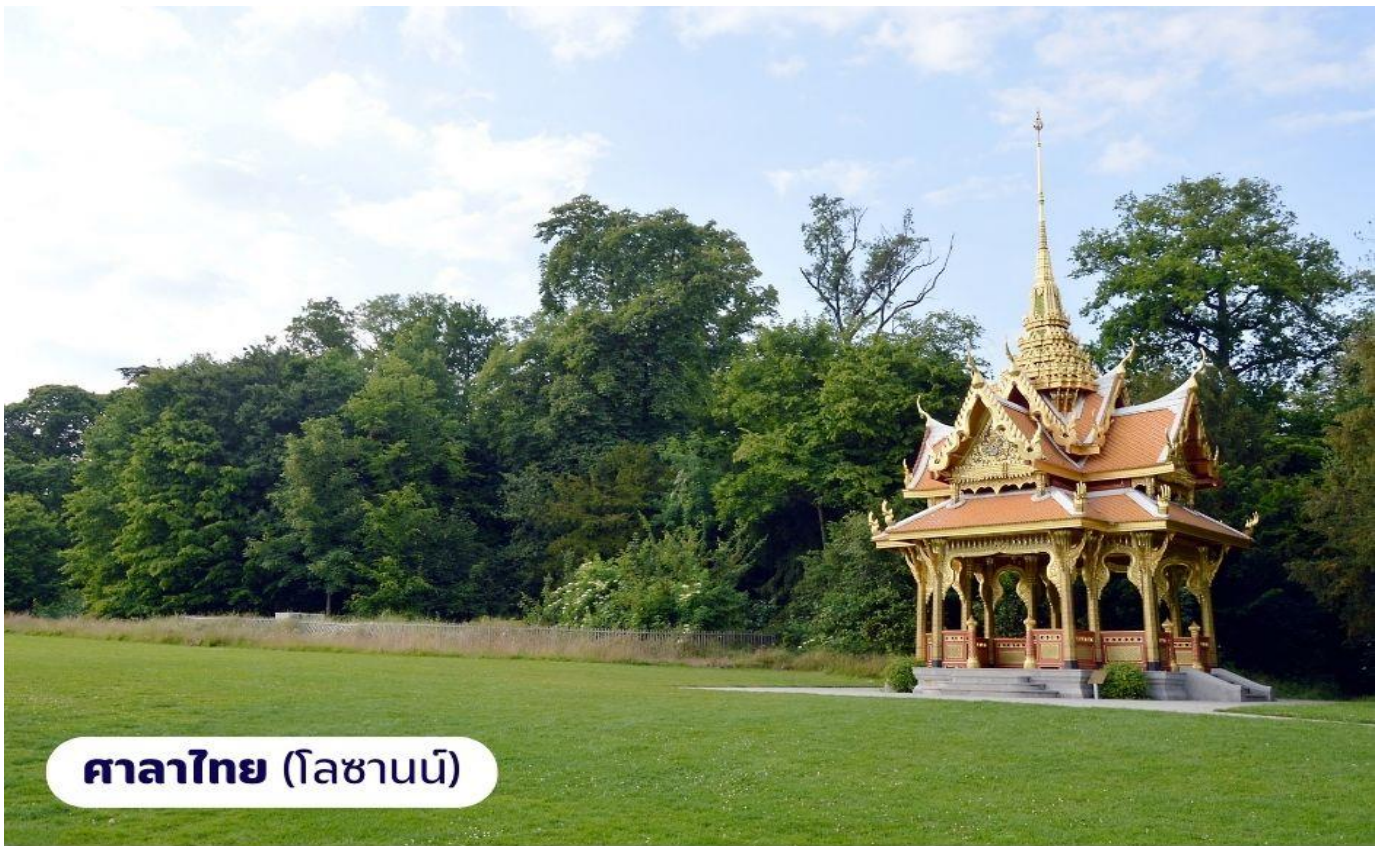
ศาลาไทย (โลซานน์)

จากนั้นนำท่านเดินทางไปยัง เมืองโลซานน์ เป็นอีกเมืองที่ตั้งอยู่บนของทะเลสาบเจนีวา เมืองโลซานน์นับได้ว่าเป็นเมืองที่มีเสน่ห์โดยธรรมชาติมากที่สุดเมืองหนึ่งของ สวิตเซอร์แลนด์มีประวัติศาสตร์อันยาวนานมาตั้งแต่ศตวรรษที่ 4 ในสมัยที่ชาวโรมันมาตั้งหลักแหล่งอยู่บริเวณริมฝั่งทะเลสาบที่นี่ เนื่องจากเมืองโลซานน์ตั้งอยู่บนเนินเขาริมฝั่งทะเลสาบเลคเลมังค์ จึงมีความสวยงามโดยธรรมชาติ ทิวทัศน์ที่สวยงามและอากาศที่ปราศจากมลพิษ จึงดึงดูดนักท่องเที่ยวจากทั่วโลกให้มาพักผ่อนตากอากาศที่นี่ เมืองนี้ยังเป็นเมืองที่มีความสำคัญสำหรับชาวไทยเนื่องจากเป็นเมืองที่เคยเป็นที่ประทับของสมเด็จพระเจ้านำท่านถ่ายภาพ อาคารสำนักงานโอลิมปิกสากล ซึ่งตั้งอยู่บริเวณทะเลสาบเลคเลมังค์ จากนั้นนำท่านถ่ายภาพและเยี่ยมชม ศาลาไทย ที่รัฐบาลไทยได้ร่วมกันก่อสร้างให้เมืองโลซานน์ ในโอกาสเฉลิมฉลองพระบาทสมเด็จพระเจ้าอยู่หัวทรงครองราชย์ครบ 60 ปี และเชื่อมความสัมพันธ์ไทย-สวิสฯ ครบ 75 ปี