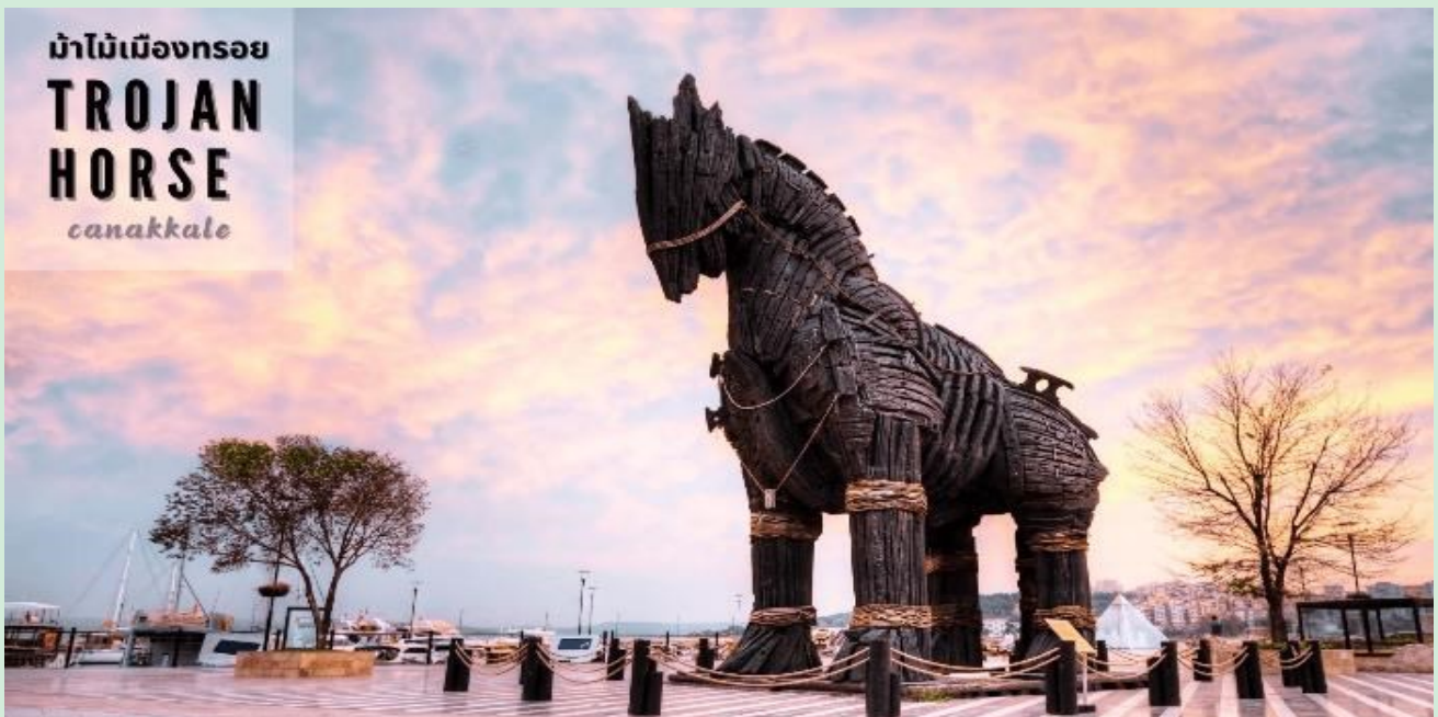
ม้าไม้เมืองทรอย TROJAN HORSE canakkale

แนวถ่ายรูป HOLLYWOOD ม้าไม้จำลองเมืองทรอย (WOODEN HORSE OF TROY) ซึ่งอยู่ใจกลางเมืองชานัคคาเล่ ม้าไม้เมืองทรอยตามเรื่องเล่านี้เกิดจากการต่อสู้ระหว่างกองทัพกรีกและกรุงทรอย ต่อสู้กันนานนับสิบปี กองทัพกรีกจึงคิดแผนการที่จะตีกรุงทรอยโดยการสร้างม้าไม้ โดยทหารกรีกได้เข้าไปซ่อนตัวอยู่ภายในช่องต่างๆของม้าและเข้าไปไว้หน้าเมืองทรอย ชาวเมืองทรอยเห็นก็นึกว่ากองทัพกรีกได้ถอยทัพยอมแพ้ไปแล้วและมอมม้าไม้จำลองเป็นของขวัญ จึงเซ็นเข้าไปไว้ในเมือง ตกกลางคืนชาวทรอยนอนหลับหมด ทหารที่ซ่อนอยู่ในม้าก็ออกมาเปิดประตูให้กองทัพกรีกเข้ามาทำการยึด และเผากรุงทรอยจนย่อยยับ ซึ่งม้าไม้จำลองแห่งเมืองทรอยที่เห็นอยู่ในเมืองชานัคคาเล่ นี้ได้รับมาจากกองถ่ายทำละคร วอเนอร์ บราเธอร์ ใช้ถ่ายทำละคร เรื่องทรอย เมื่อถ่ายทำเสร็จแล้วจึงยกให้เป็นสมบัติของที่นี่ตั้งแต่ปี 2004 อิสระเก็บภาพประทับใจตามอัธยาศัย จนถึงเวลานัดหมาย