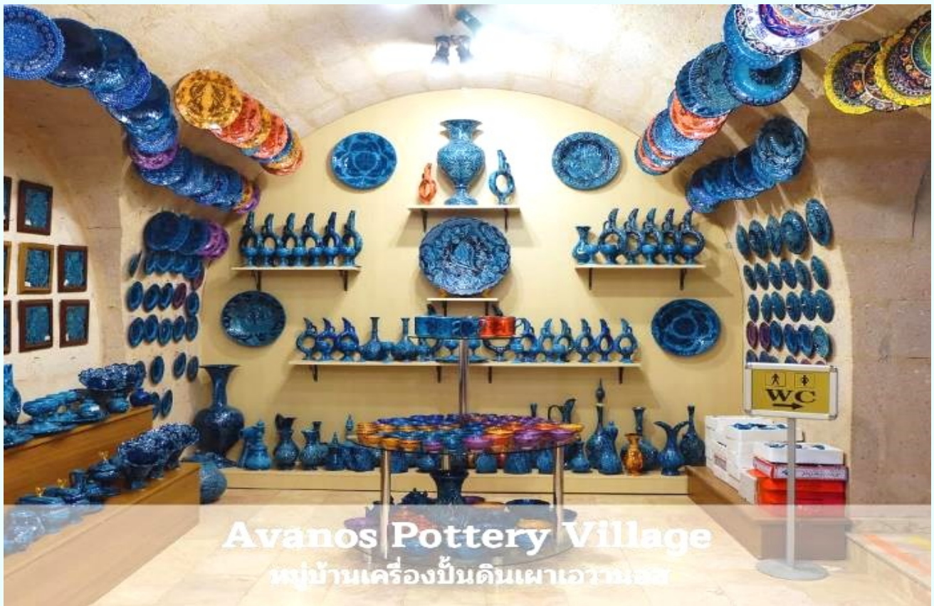
Avanos Pottery Village หมู่บ้านเครื่องปั้นดินเผาอวานอส

จากนั้นนำท่านแวะชม หมู่บ้านเครื่องปั้นดินเผาอวานอส (AVANOS) หมู่บ้านที่มีชื่อเสียงเกี่ยวกับเครื่องปั้นดินเผา อุปกรณ์ที่ใช้ภายในบ้าน ถ้วย,ชาม,ไห,โอง,แจกันและเครื่องประดับบ้าน