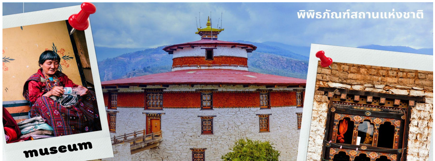
พิพิธภัณฑ์สถานแห่งชาติ

เที่ยง รับประทานอาหารเที่ยง ณ ภัตตาคาร (มื้อที่ 1)