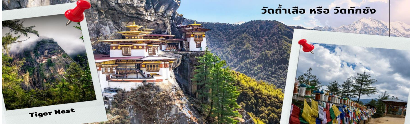
วัดถ้ำเสือ หรือ วัดทักซัง

ผาสูงชันราว 3,000 เมตรจากด้านล่าง แนะนำนักท่องเที่ยวค่อยๆ เดินขึ้นไปช้าๆ ราว 2 ชม. จะถึงจุดพักครึ่งทาง พักดื่ม น้ำชา กาแฟ ) จากนั้นเดินทางต่ออีกราว 1 ชม.ก็จะถึงสุดทางดินลูกรังสุดท้าย จากนั้นเส้นทางจะเปลี่ยนเป็นบันไดขึ้นลง 700 ขั้น สู่ยัง วัดทักซัง ด้านใน นำทุกท่านสักการะสิ่งศักดิ์สิทธิ์ และ ชมความงามของธรรมชาติที่สรรค์สร้างอย่างวิจิตรลงตัว