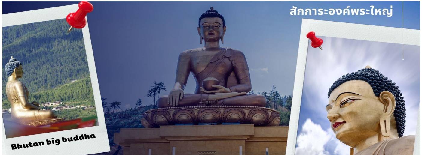
สักการะองค์พระใหญ่

CB3BT1 ภูฏาน 5 วัน 4 คืน ภูฏาน แอร์ไลน์ B3 (Jun-Oct 24)