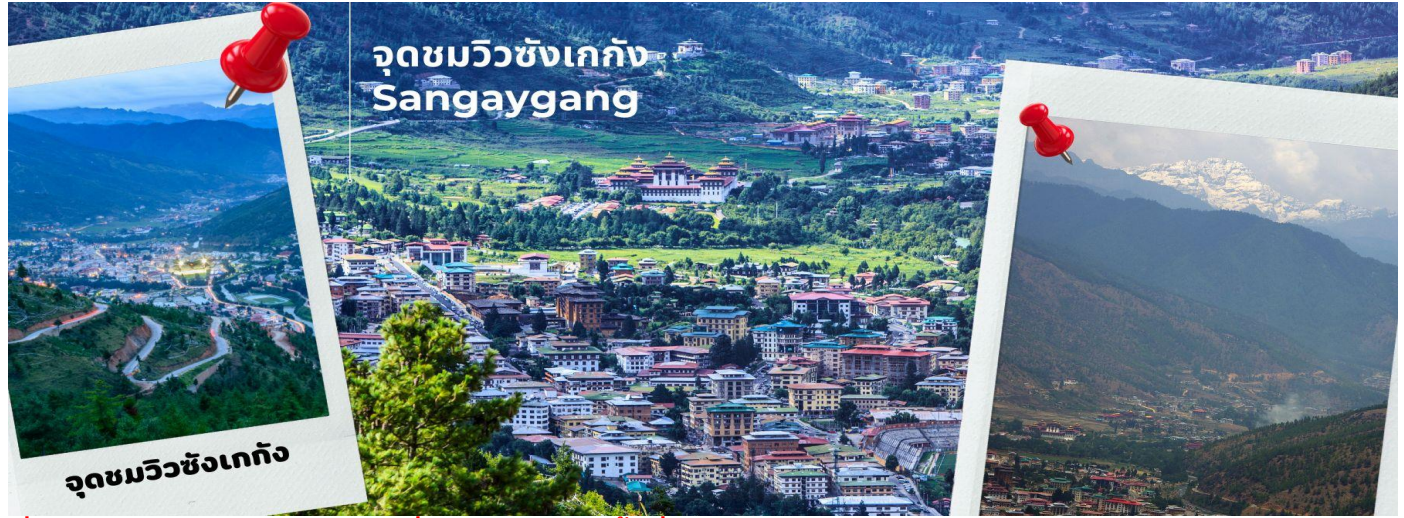
จุดชมวิวซังเกกัง Sangaygang

นำท่านชม จุดชมวิวซังเกกัง (Sangaygang) จุดชมวิวทิวทัศน์ที่สวยงามของหุบเขาเมืองทิมพู เพื่อเก็บภาพประทับใจ จากนั้นนำทุกท่านเดินทางสู่เมืองพาโร ใช้เวลาประมาณ 1 ชั่วโมง