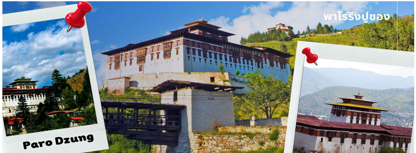
ปาร์ริงปูซง

นำท่านเดินทางไม่ไกล ชม พิพิธภัณฑ์สถานแห่งชาติ พิพิธภัณฑ์แห่งนี้เป็นที่เก็บรวบรวมหน้ากากศิลปะแบบพุทธมหายาน นิกายตันตระ ภาพพระบฏ อวูธ เหริยญกษาปณ์ เครื่องมือเครื่องใช้ไม้สอยต่างๆ รวมถึงจัดแสดงความหลากหลายทางธรรมชาติอันสมบูรณ์ของประเทศเพื่อให้ทุกท่านได้รู้จักภูฏานมากขึ้น ตรงข้ามกับอาคารพิพิธภัณฑ์ เป็นอาคารทรงกลมสีขาว เรียกว่า ตาซอง (Ta Dzong) หรือ หอคอย เดิมใช้เป็นหอสังเกตการณ์ข้าศึกศัตรูเนื่องจาก สร้างอยู่บนเนินสูง สามารถมองวิวตัวเมืองปาร์ได้โดยรอบ