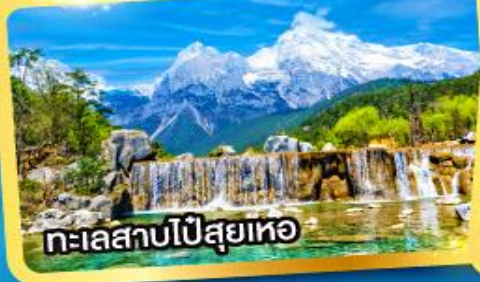
ทะเลสาบไป๋สุยเหอ