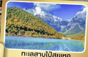
ทะเลสาบไป๋สือเหอ