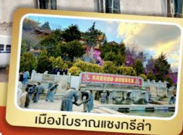
เมืองโบราณแชงกรีล่า