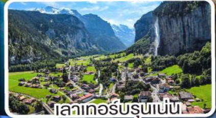
เลาเกอร์บรุนเนน