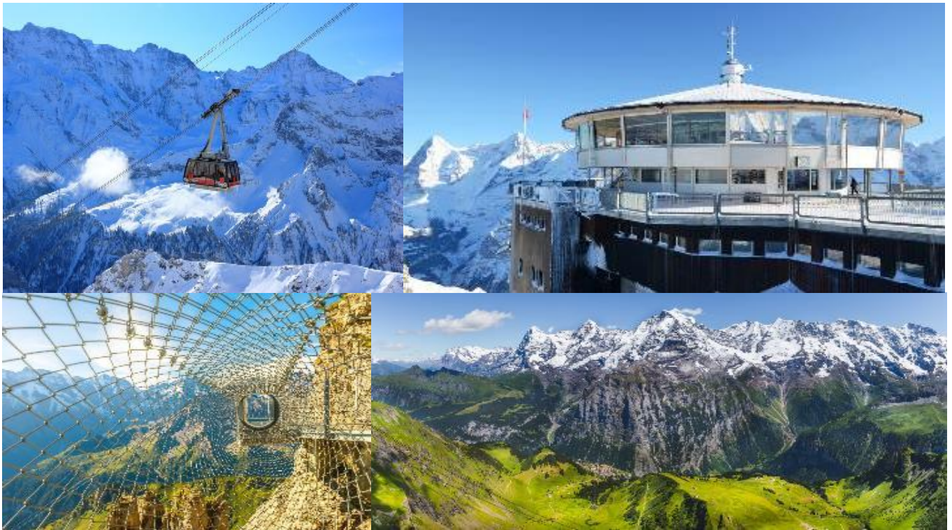
GO3VIE-EK008 น้ำร้อนปลาเป็น น้ำเย็นที่สวิส

นำท่านเดินทางสู่ ทะเลสาบเบรียนซ์ (Brienz Lake) วิวสวยอีกแห่งของประเทศสวิตเซอร์แลนด์ ชมความสวยงามระหว่างทางกันบ้าง หมู่บ้าน และ เมืองน่ารัก หลายที่ตั้งอยู่ติดกับริมทะเลสาบ ตามรอยซีรีส์เรื่องดังของเกาหลีอย่าง Crash Landing on you มีเวลาให้ท่านได้ชื่นชมความงดงามของทะเลสาบ