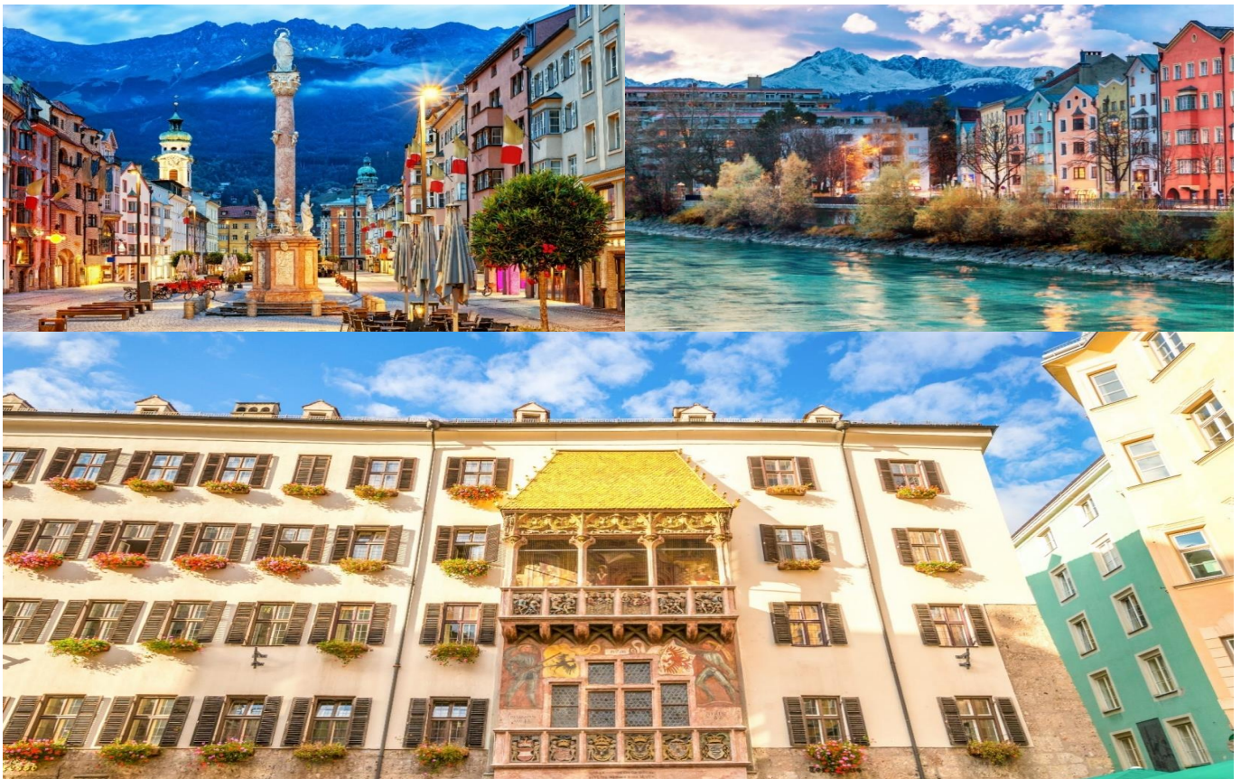
GO3VIE-EK008 น้ำร้อนปลาเป็น น้ำเย็นที่สวิต

เช้า รับประทานอาหารเช้า ณ ห้องอาหารโรงแรม