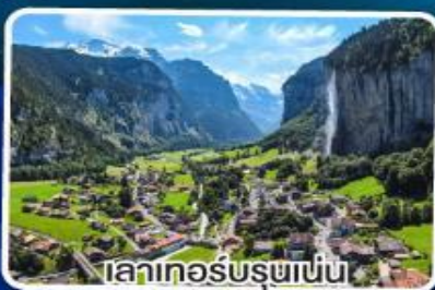
เลาเทอร์บรุชเนิน