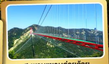
สะพานแขวนอ้ายจ้าย