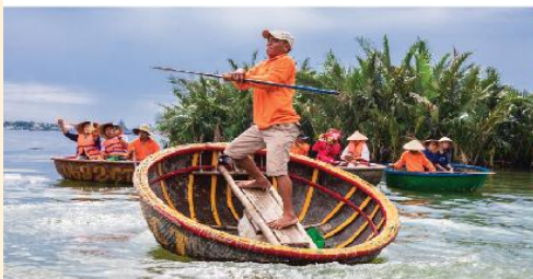
เรือกระดง