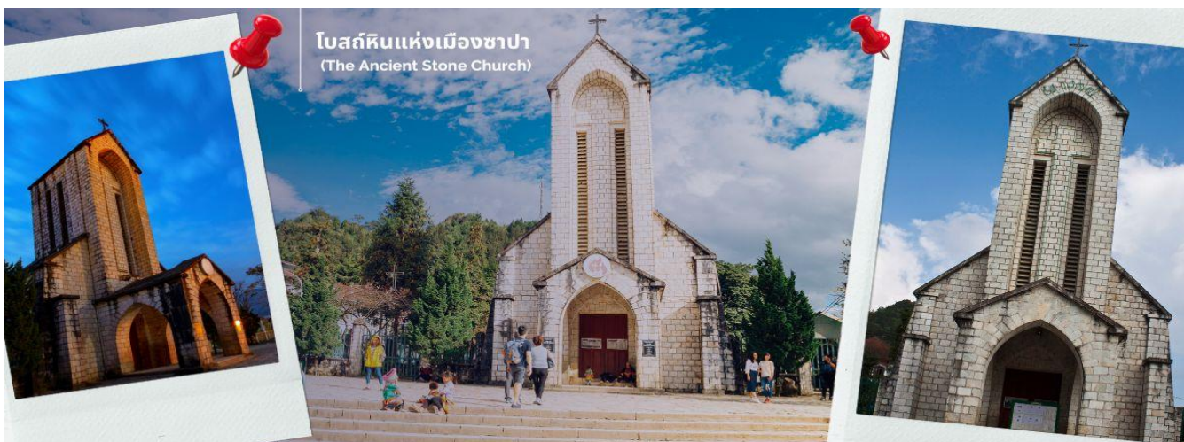
โบสถ์หินแห่งเมืองซาปา (The Ancient Stone Church)

นำท่านช้อปปิ้งที่ ตลาดไนท์เมืองซาปา มีสินค้าให้ท่านเลือกช้อปปิ้งมากมาย ไม่ว่าจะเป็นสินค้าพื้นเมืองของฝาก ขนม กระเป๋า รองเท้า ท่านสามารถช้อปปิ้งได้อย่างจุใจ