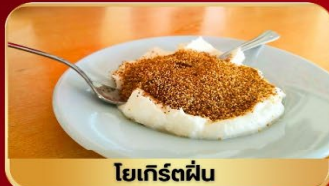
โยเกิร์ตผืน