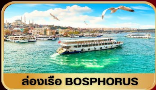
ล่องเรือ BOSPHORUS