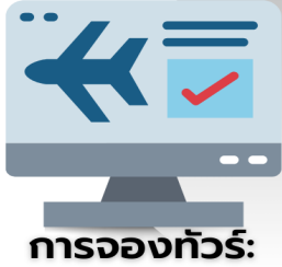
การจองทัวร์: