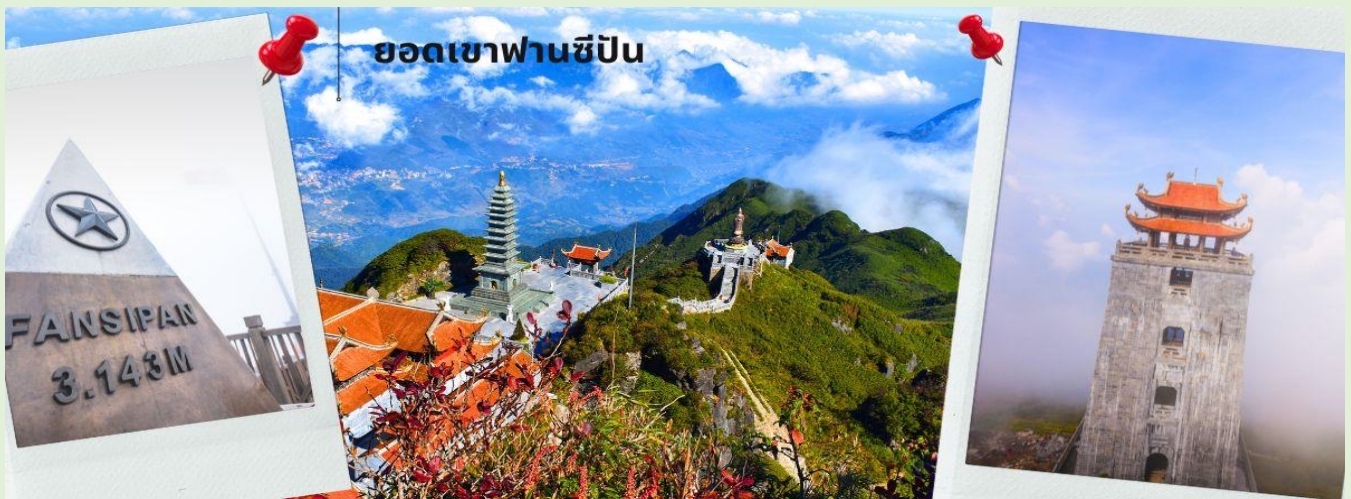
ยอดเขาฟานซีปัน

จากนั้นนำท่าน นั่งกระเช้าขึ้นเขาฟานซีปัน (รวมค่ากระเช้าขึ้นเขา) ข้ามภูเขากว่า 7 กิโลเมตร ใช้เวลาประมาณ 15 นาที ข้ามเทือกเขาอันยิ่งใหญ่มากมายสู่เทือกเขา ฟานซีปัน ท่ามกลางมวลเมฆหมอกที่ลอยละล่องอยู่รอบๆ ชมทัศนียภาพที่แสนสวยงามบนจุดชมวิวในระดับความสูง 3,143 เมตร จุดที่ได้รับการขนานนามว่าเป็นหลังคาแห่งอินโดจีน ด้วยทิวทัศน์แบบพาโนรามาพร้อมสัมผัสอากาศที่หนาวเย็นตลอดทั้งปี ท่านสามารถเดินขึ้นสู่จุดสูงสุดของยอดเขาฟานซีปัน หรือเลือกใช้บริการรถราง (ไม่รวมรถรางขึ้นสู่ยอดเขาฟานซีปัน) เพื่อพิชิตสูงที่สุดในเอเชียตะวันออกเฉียงใต้ หรือหลังคาแห่งอินโดจีน