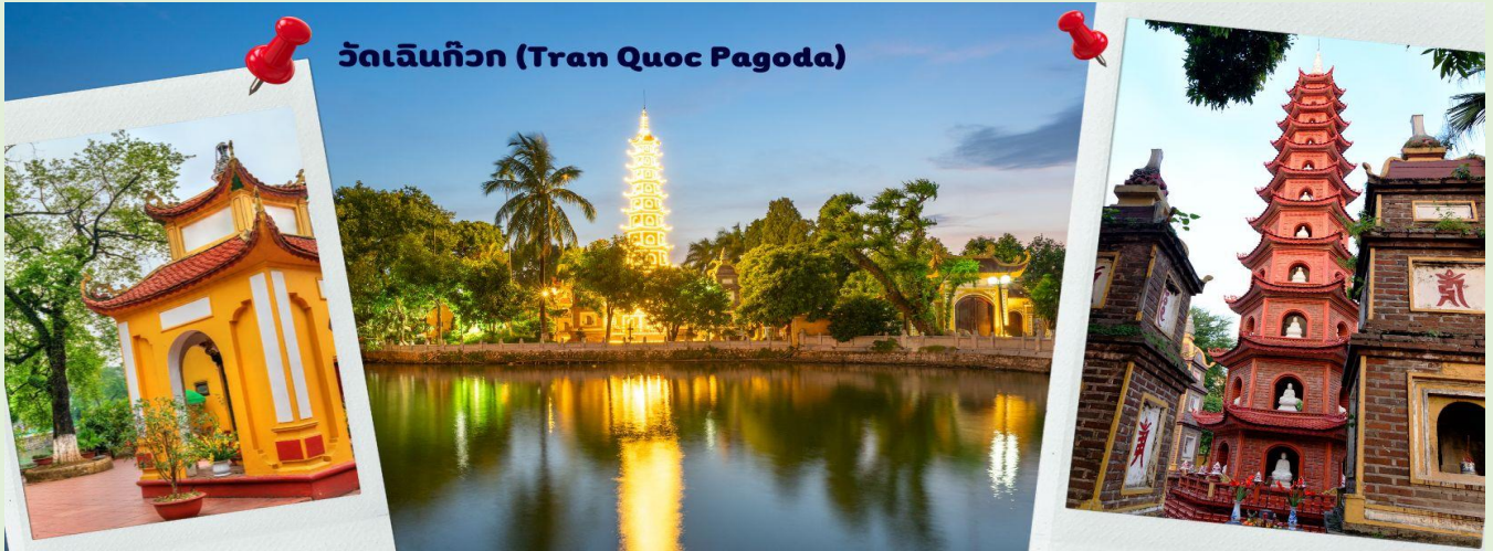
วัดเจินก๊วก (Tran Quoc Pagoda)

จากนั้นนำท่านไป วัดเจินก๊วก (Tran Quoc Pagoda) เป็นวัดที่อยู่ใจกลางเมืองของเวียดนาม ใกล้ชิดกับทะเลสาบตะวันตกของเมืองฮานอย สร้างด้วยสถาปัตยกรรมจีนโบราณ มีความร่มรื่น และบรรยากาศดี จึงเป็นที่นิยมของนักท่องเที่ยวทั้งที่ชื่นชมความงามและมีศรัทธาในพระพุทธศาสนา จากภาพมุมสูงของสถานที่ตั้ง ที่นี้เหมือนตั้งอยู่บนเกาะที่ยื่นลงไปทะเลสาบ แต่มีเส้นทางคมนาคมเข้าถึงที่ สิ่งปลูกสร้างมีการวางผังเป็นอย่างดี ใช้สีสันทึกลมกลืนในโทนสีเหลือง น้ำตาล ตัดกับสีเขียวของต้นไม้ใหญ่ที่โอบล้อมอยู่ในมุมถ่ายภาพจากอีกฝั่งหนึ่ง จะเห็นสิ่งปลูกสร้างสไตล์จีน และเจดีย์หลายชั้นโดดเด่น มีภาพที่สะท้อนลงสู่ผิวน้ำเป็นภูมิทัศน์ที่งดงามทั้งยามกลางวันและยามค่ำคืนที่มีการเปิดไฟส่องสว่าง