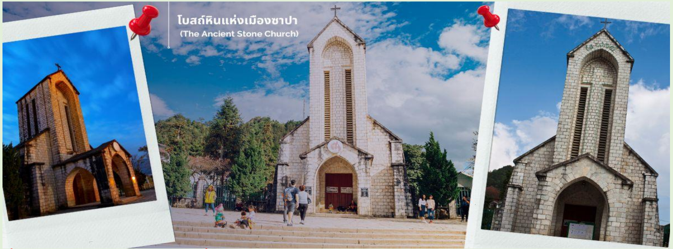
โบสถ์หินแห่งเมืองซาปา (The Ancient Stone Church)

นำท่านช้อปปิ้งที่ ตลาดไนต์เมืองซาปา มีสินค้าให้ท่านเลือกช้อปปิ้งมากมาย ไม่ว่าจะเป็นสินค้าพื้นเมืองของฝัก ขนมห กระเป๋า รองเท้า ท่านสามารถช้อปปิ้งได้อย่างจุใจ