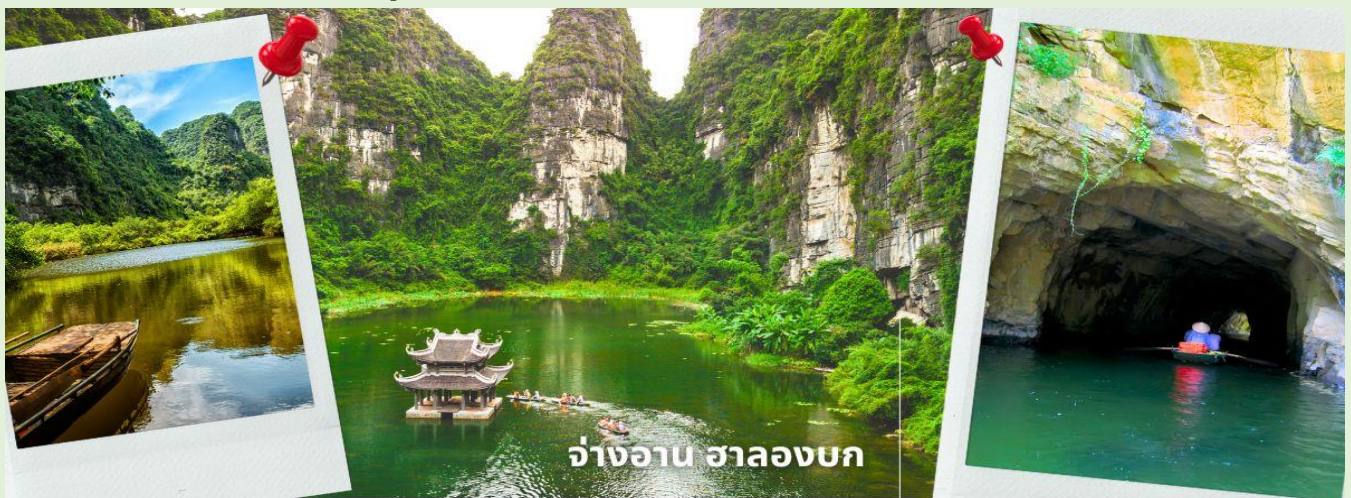
จ่างอาน ฮาลองบก

จากนั้นนำท่านเดินทางสู่ จ่างอาน เป็นพื้นที่ที่มีทั้งภูมิทัศน์อันงดงามของยอดเขาหินปูน แม่น้ำหลายสายไหลลดเลาะ บางส่วนจมอยู่ใต้น้ำ และยังถูกล้อมรอบด้วยผาสูงชัน จึงทำให้สถานที่แห่งหนึ่งงดงามน่าชม การขึ้นชมทัศนียภาพที่สวยงามในจ่างอานนั้น คือการล่องเรือเล็กประมาณลำละ 4-5 คนเพื่อเข้าไปเยี่ยมชมจ่างอาน เรือแจวกก็จะพาเราไปเยี่ยมชมวัด หลังจากนั้นก็จะพาเราไปลอดถ้ำ มีทั้งหมด 49 ถ้ำ ซึ่งแต่ละถ้ำจะมีชื่อแตกต่างกันไปจะใช้เวลาล่องเรือไปกลับร่วมสองชั่วโมงเลย ที่เดียว จ่างอานยังถูกเรียกว่า ฮาลองบก เพราะที่นี่มีเขาหินปูนและถ้ำคล้ายกับที่อ่าวฮาลอง