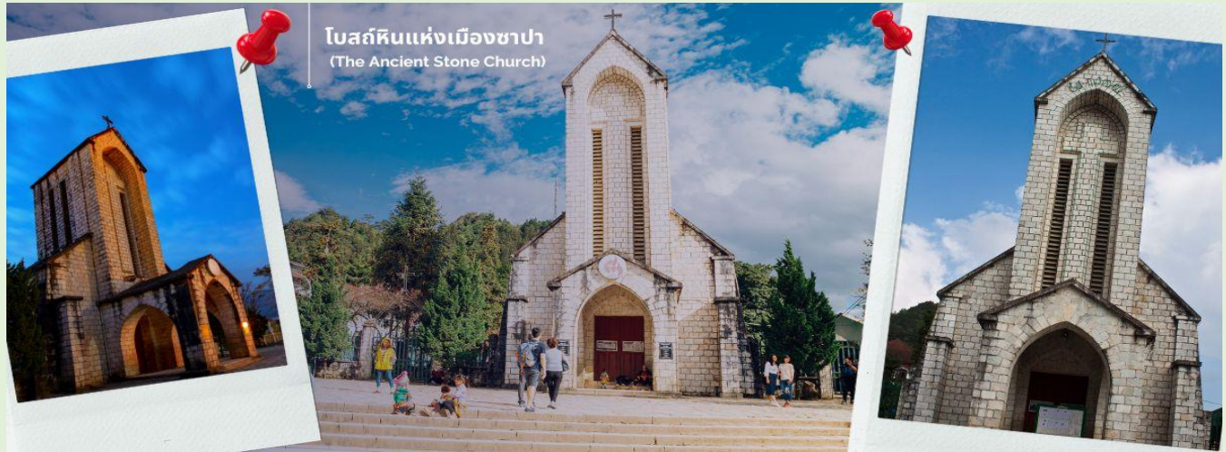
โบสถ์หินแห่งเมืองซาปา (The Ancient Stone Church)

นำท่านช้อปปิ้งที่ ตลาดไนต์เมืองซาปา มีสินค้าให้ท่านเลือกช้อปปิ้งมากมาย ไม่ว่าจะเป็นสินค้าพื้นเมืองของฝัก ขนมห กระเป๋า รองเท้า ท่านสามารถช้อปปิ้งได้อย่างจุใจ