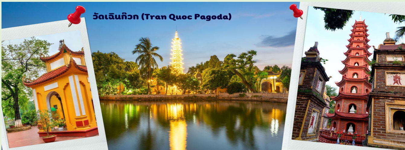
วัดเจินก๊วก (Tran Quoc Pagoda)

จากนั้นนำท่านไป วัดเจินก๊วก (Tran Quoc Pagoda) เป็นวัดที่อยู่ใจกลางเมืองของเวียดนาม ใกล้ชิดกับทะเลสาบตะวันตกของเมืองฮานอย สร้างด้วยสถาปัตยกรรมจีนโบราณ มีความร่มรื่น และบรรยากาศดี จึงเป็นที่นิยมของนักท่องเที่ยวทั้งที่ชื่นชอบความงามและมีศรัทธาในพระพุทธศาสนา จากภาพมุมสูงของสถานที่ตั้ง ที่เหมือนตั้งอยู่บนเกาะที่ยื่นลงไปในทะเลสาบ แต่มีเส้นทางคมนาคมเข้าถึงที่ สิ่งปลูกสร้างมีการวางผังเป็นอย่างดี ใช้สีสันทึกลมกลืนในโทนสีเหลือง น้ำตาล ตัดกับสีเขียวของต้นไม้ใหญ่ที่โอบล้อมอยู่ในมุมถ่ายภาพจากอีกฝั่งหนึ่ง จะเห็นสิ่งปลูกสร้างสไตล์จีน และเจดีย์หลายชั้นโดดเด่น มีภาพที่สะท้อนลงสู่ผิวน้ำเป็นภูมิทัศน์ที่งดงามทั้งยามกลางวันและยามค่ำคืนที่มีการเปิดไฟส่องสว่าง