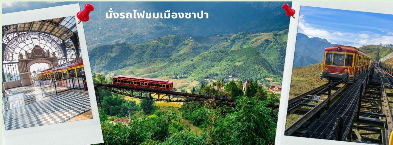
นั่งรถไฟไซมเมืองซาปา

นำท่าน นั่งรถไฟไซมเมืองซาปา (รวมค่ารถไฟไซมเมือง) ท่านจะได้พบกับวิวทิวทัศน์ของเมืองซาปาที่เต็มไปด้วยความสดชื่น และสุดกลิ่นอายธรรมชาติ และยังตื่นตาไปด้วยวิวภูเขา และนาขั้นบันได ที่มีชื่อเสียงของเมืองซาปาอีกด้วย ความยาวประมาณ 2 กิโลเมตร โดยใช้เวลาประมาณ 20 นาทีเพื่อไปสู่สถานีขึ้นกระเช้าที่จะนำท่านขึ้นสู่ยอดเขาฟานซีปัน