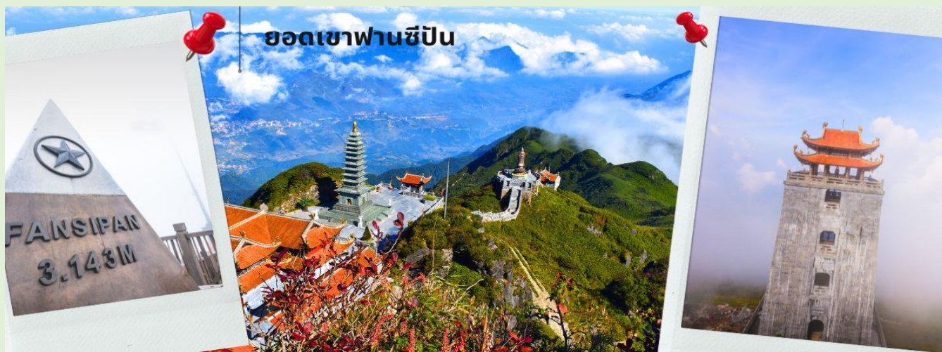
ยอดเขาฟานซีปัน

จากนั้นนำท่าน นั่งกระเช้าขึ้นเขาฟานซีปัน (รวมค่ากระเช้าขึ้นเขา) ข้ามภูเขากว่า 7 กิโลเมตร ใช้เวลาประมาณ 15 นาที ข้ามเทือกเขาน้อยใหญ่มากมายสู่เทือกเขา ฟานซีปัน ท่ามกลางมวลเมฆหมอกที่ลอยละล่องอยู่รอบๆ ชมทัศนียภาพที่แสนสวยงามบนจุดชมวิวในระดับความสูง 3,143 เมตร จุดที่ได้รับการขนานนามว่าเป็นหลังคาแห่งอินโดจีน ด้วยทิวทัศน์แบบพาโนรามาพร้อมสัมผัสอากาศที่หนาวเย็นตลอดทั้งปี ท่านสามารถเดินขึ้นสู่จุดสูงสุดของยอดเขาฟานซีปัน หรือเลือกใช้บริการรถราง (ไม่รวมรถรางขึ้นสู่ยอดเขาฟานซีปัน) เพื่อพิชิตสูงที่สุดในเอเชียตะวันออกเฉียงใต้ หรือหลังคาแห่งอินโดจีน