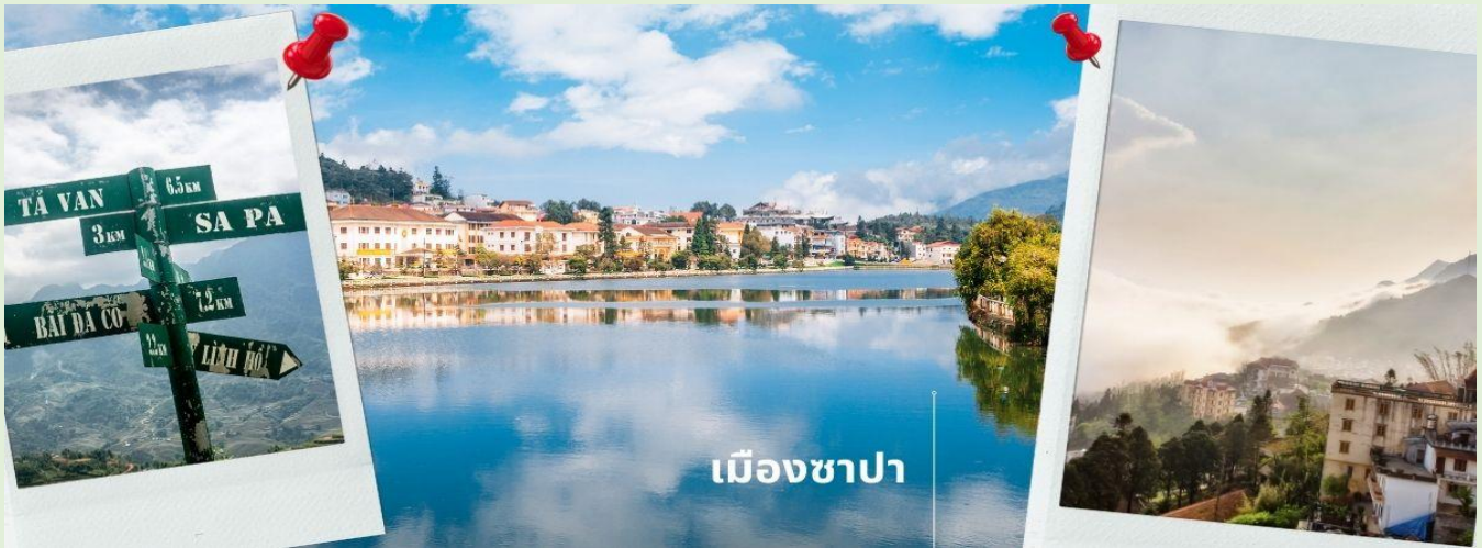
เมืองซาปา

นำท่านเดินทางขึ้นเหนือมุ่งหน้าสู่ เมืองซาปา ซึ่งตั้งอยู่ทางภาคเหนือของประเทศเวียดนามใกล้กับชายแดนจีน อยู่ในเขตจังหวัดลาวไก ตัวเมืองตั้งอยู่บนระดับความสูงกว่าระดับน้ำทะเลถึง 1,650 เมตร จึงมีอากาศหนาวเย็นตลอดปี ที่นี่จึงเป็นแหล่งปลูกผักและผลไม้เมืองหนาวที่สำคัญของเวียดนาม อีกทั้งยังเป็นดินแดนแห่งขุนเขาที่มีความหลากหลายของชาติพันธุ์มากที่สุดในเวียดนามอีกด้วย ในอดีตเมืองนี้ถูกพัฒนาขึ้นเป็นเมืองตากอากาศของชาวฝรั่งเศส...สมัยที่เวียดนามเป็นอาณานิคมของฝรั่งเศส (ระยะทาง 350 กิโลเมตร ใช้เวลาเดินทางประมาณ 5-7 ชั่วโมง)