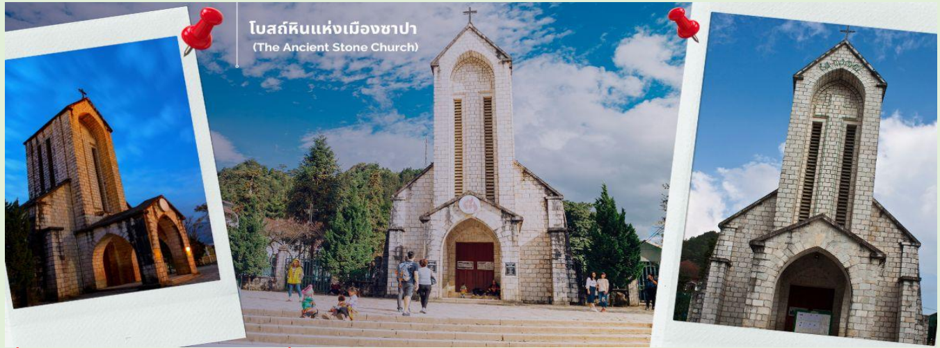
โบสถ์หินแห่งเมืองซาปา (The Ancient Stone Church)

นำท่านช้อปปิ้งที่ ตลาดไนต์เมืองซาปา มีสินค้าให้ท่านเลือกช้อปปิ้งมากมาย ไม่ว่าจะเป็นสินค้าพื้นเมืองของฝัก ขนมห กระเป๋า รองเท้า ท่านสามารถช้อปปิ้งได้อย่างจุใจ