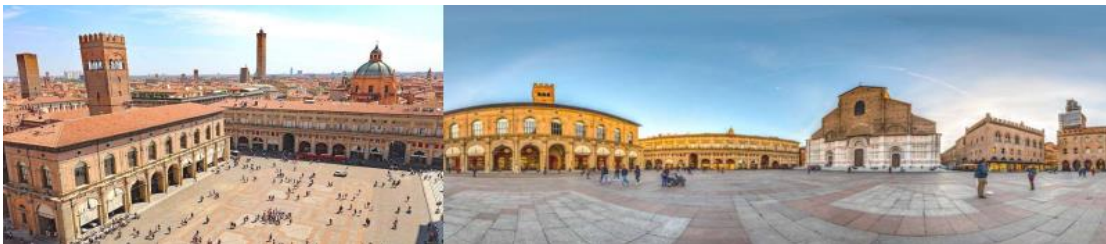
Italy Classic 8D5N (MXP-FCO), 1K on 16-23 Oct 2024

เช้า รับประทานอาหารเช้าในโรงแรม -ชมบริเวณ จัตุรัสมัจโจเร่ Piazza Maggiore จัตุรัสขนาดใหญ่ที่ตั้งอยู่ใจกลางเมืองเก่าที่ล้อมรอบด้วยโบสถ์ซานเปโตรนิโอ ที่สร้างขึ้นเพื่อถวายแด่นักบุญเปโตรนิโอพระสังฆราชองค์แรกของโบโลญญา