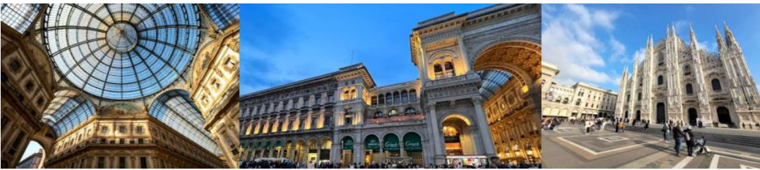
Italy Classic 8D5N (MXP-FCO) , TK on 16-23 Oct 2024

05.15 น. เดินทางถึงสนามบินอิสตันบูล ประเทศตุรเกีย เพื่อแวะเปลี่ยนเครื่อง 07.35 น. ออกเดินทางสู่เมืองมิลาน ประเทศอิตาลี โดยสายการบิน Turkish Airlines เที่ยวบินที่ TK-1873 09.30 น. เดินทางถึงสนามบินมาเฟินซาร์ เมืองมิลาน ประเทศอิตาลี หลังผ่านขั้นตอนการตรวจคนเข้าเมือง และตรวจรับสัมภาระเรียบร้อยแล้ว นำท่านเดินทางสู่ใจกลางเมืองมิลาน หรือมิลานโ Milano เมืองหลักของแคว้นลอมบาร์เดียและเป็นเมืองสำคัญทางภาคเหนือของประเทศอิตาลี -นำท่านชมความยิ่งใหญ่และถ่ายรูปภายนอกของ มหาวิหารแห่งเมืองมิลานหรือมิลานดูโอโม ที่มีความวิจิตรงดงามและประดับประดาไปด้วยรูปปั้นกว่า 3,000 รูป มีหลังคายอดเรียวแหลมกว่า 135 ยอด -อิสระให้ท่านช้อปปิ้งที่แกลเลอรี วิคเตอร์ เอ็มมานูเอล ช้อปปิ้งอาเขตที่สวยงามที่สุดในอิตาลีที่มีสินค้าแบรนด์ดังที่ทันสมัยทั้งเสื้อผ้า กระเป๋า รองเท้า และนาฬิกาแบรนด์ชื่อดังมากมาย อาทิ Louis Vuitton, Prada, Versace, Gucci, Armani, Bvlgari