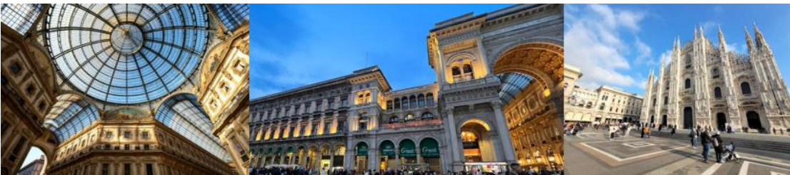
Italy Classic 8D5N (MXP-FCO) , TK on 16-23 Oct 2024

วันที่สอง อิสตันบูล (ตุรกี) - มิลาน (อิตาลี) - เวนิสเมสเตรี่ 05.15 น. เดินทางถึงสนามบินอิสตันบูล ประเทศตุรกี เพื่อแวะเปลี่ยนเครื่อง 07.35 น. ออกเดินทางสู่เมืองมิลาน ประเทศอิตาลี โดยสายการบิน Turkish Airlines เที่ยวบินที่ TK-1873 09.30 น. เดินทางถึงสนามบินมาเฟินซาร์ เมืองมิลาน ประเทศอิตาลี หลังผ่านขั้นตอนการตรวจคนเข้าเมือง และตรวจรับสัมภาระเรียบร้อยแล้ว นำท่านเดินทางสู่ใจกลางเมืองมิลาน หรือมิลานโ Milano เมืองหลักของแคว้นลอมบาร์เดียและเป็นเมืองสำคัญทางภาคเหนือของประเทศอิตาลี -นำท่านชมความยิ่งใหญ่และถ่ายรูปภายนอกของ มหาวิหารแห่งเมืองมิลานหรือมิลานดูโอโม ที่มีความวิจิตรงดงามและประดับประดาไปด้วยรูปปั้นกว่า 3,000 รูป มีหลังคายอดเรียวแหลมกว่า 135 ยอด -อิสระให้ท่านช้อปปิ้งที่แกลเลอรี วิคเตอร์ เอ็มมานูเอล ช้อปปิ้งอาเขตที่สวยงามที่สุดในอิตาลีที่มีสินค้าแบรนด์ดังที่ทันสมัยทั้งเสื้อผ้า กระเป๋า รองเท้า และนาฬิกาแบรนด์ชื่อดังมากมาย อาทิ Louis Vuitton, Prada, Versace, Gucci, Armani, Bvlgari