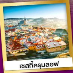
เชสกั้ครุมลอฟ