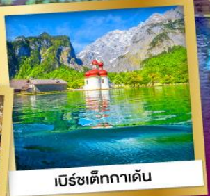
เบร์ชเต็กกาเด้น