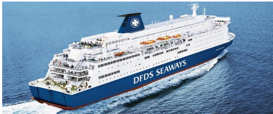
Nice Scan 3Countries 9D6N, TK (Sweden-Norway-Denmark) on Sep, Oct 2024