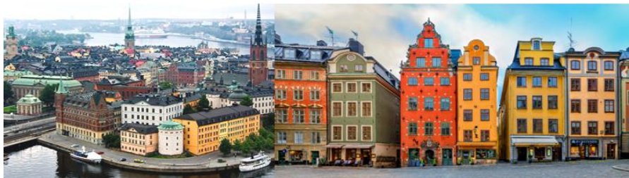
Nice Scan 3Countries 9D6N, TK (Sweden-Norway-Denmark) on Sep, Oct 2024

10.10 น. เดินทางถึงสนามบินอาร์รันดา กรุงสต็อกโฮล์ม ประเทศสวีเดน หลังนำท่านผ่านพิธีการตรวจคนเข้าเมือง และตรวจรับสัมภาระเรียบร้อยแล้ว นำท่านเดินทางสู่ใจกลางกรุงสต็อกโฮล์ม Stockholm เมืองหลวงของประเทศสวีเดน ซึ่งอยู่บนหมู่เกาะใหญ่น้อยโอบล้อมด้วยทะเลสาบมาลาร์กอก่าเกิดนครอันงามสง่า ริมคลองมากมายจนได้รับฉายาว่า “ราชินีแห่งทะเลบอลติก” นำท่านชม แกมล่าสแตน Gamla Stan หรือเขตเมืองเก่า และ ชมศาลาว่าการเมืองสต็อกโฮล์ม City Hall สัญลักษณ์ของกรุงสต็อกโฮล์ม