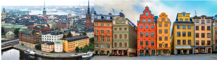
Nice Scan 3Countries 9D6N, TK (Sweden-Norway-Denmark) on Sep, Oct 2024