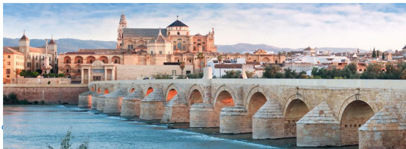
Spain & Portugal 10D7N , SV /

รับประทานอาหารเช้าในโรงแรม นำท่านเดินทางสู่ เมืองคอร์โดบา Cordoba อดีตเมืองหลวงของชาวแชนกัวร์ที่เจริญรุ่งเรืองของอาณาจักร กาลิฟแห่งคอร์โดบา (ใช้เวลาเดินทางประมาณ 2 ชั่วโมง) นำท่าน ชมเมืองคอร์โดบา Cordoba เมืองที่สวยงามในแบบมูเดก้าและเป็นเมืองที่เจริญรุ่งเรืองที่สุดในยุคที่ มัวร์ปกครอง นำท่านชมย่านเมืองเก่าที่ยังคงมีสถาปัตยกรรมน่าประทับใจหลายแห่งที่ย้อนไปเมื่อครั้งเมืองนี้ เป็นเมืองหลวงที่เจริญรุ่งเรือง ชมสะพานโรมัน Puente Romano เป็นสะพานสำหรับการสัญจรข้ามแม่น้ำ กัวดัลกีวีร์มีอายุราว 2 พันปี โดยบริเวณเมืองเก่ายังเป็นที่ตั้งของมหาวิหารกอร์โดบา Mezquita Cathedral หรือในอดีตคือมัสยิดใหญ่แห่งกอร์โดบา The Mosque-Cathedral of Córdoba หนึ่งในมรดกโลก ชมบริเวณ ชุมชนเมืองเก่า และถ่ายรูปกับถนนดอกไม้อันเป็นสัญลักษณ์ของคอร์โดบาที่ปรากฏอยู่บนโปสการ์ดทั่วไป