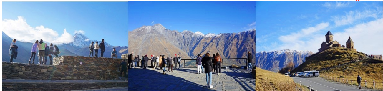
Summer in Georgia 024IN (1BS-1BS), UN SEP 2024 (รวมสงวนที่ 1120UL)

นำท่านเดินทางสู่ เมืองสเตพานท์สมินดา Stepantsminda หรือที่รู้จักกันในนามเมืองคาสเบกี Kazbegi ซึ่งคาสเบกีเป็นชื่อเมืองดั้งเดิมนั่นเอง ตั้งอยู่บนความสูงจากระดับน้ำทะเลประมาณ 1,740 เมตร และมีอากาศเย็นสบายตลอดทั้งปี โดยในฤดูหนาวจะหนาวจัดถึงลบ 5 องศาเซลเซียสเลยทีเดียว จากนั้นนำท่านเปลี่ยนเป็น นั่งรถจี๊ป 4WD เพื่อชมความสวยงามของโบสถ์เกอร์เกตี Gergeti Trinity Church ซึ่งถูกสร้างขึ้นในราวศตวรรษที่ 14 หรือมีอีกชื่อเรียกกันว่าทสมินดาซามิบา Tsminda Sameba ซึ่งเป็นชื่อเรียกที่นิยมกันของโบสถ์ศักดิ์แห่งนี้สถานที่แห่งนี้ตั้งอยู่ริมฝั่งขวาของแม่น้ำชเคเรี อยู่บนเทือกเขาของคาสเบกี (การเดินทางมายังสถานที่แห่งนี้ ขึ้นอยู่กับสภาพ อากาศ ซึ่งเส้นทางอาจจะถูกปิดกั้นด้วยหิมะที่ปกคลุมอยู่หรือสภาพของการจราจร หรือเหตุการณ์ทางธรรมชาติ ซึ่งอาจจะเป็นอุปสรรคแก่การเดินทาง ทางบริษัทฯ ขอสงวนสิทธิ์เปลี่ยนแปลงรายการตามความเหมาะสม โดยจะคำนึงถึงความปลอดภัยและผลประโยชน์ของผู้