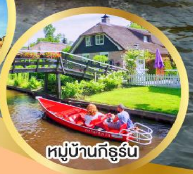
หมู่บ้านก็ธูร์น