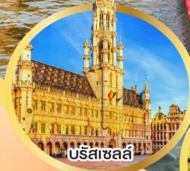
บรัสเซลส์