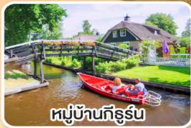
หมู่บ้านกังธูร์น