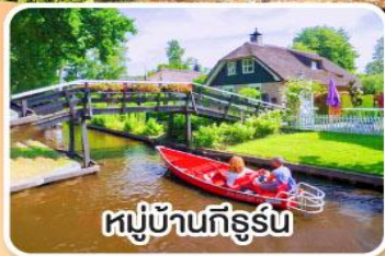
หมู่บ้านกิธูร์น