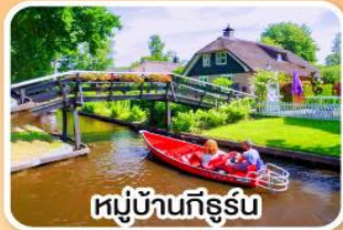
หมู่บ้านกีร์ซัน