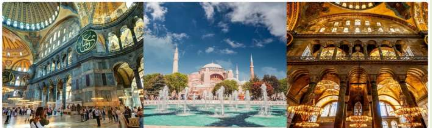
หน้า 14 (ภาพใช้เพื่อการโฆษณาเท่านั้น)

จากนั้นนำทุกท่านแวะถ่ายรูปบริเวณโดยรอบและด้านหน้า สุเหร่าเซนต์โซเฟีย (SAINT SOPHIA) หรือ โบสถ์ฮาเจีย โซเฟีย 1 ใน 7 สิ่งมหัศจรรย์ของโลกยุคกลาง ปัจจุบันเป็นที่ประชุมสวดมนต์ของชาวมุสลิม ในอดีตเป็นโบสถ์ทางศาสนาคริสต์พระเจ้าจักรพรรดิคอนสแตนติน เป็นผู้สร้างเมื่อประมาณคริสต์ศตวรรษที่ 13 ใช้เวลาสร้าง 17 ปี เพื่อเป็นโบสถ์ของศาสนาคริสต์แต่ถูกผู้ก่อการร้ายบุกทำลายเผาเสียอวตวายหลายครั้ง เพราะเกิดการขัดแย้งระหว่างพวกที่นับถือศาสนาคริสต์กับศาสนาอิสลามจวบจนถึงรัชสมัยของ พระเจ้าจัสตินเนียนมีอำนาจเหนือตุรกีจึงได้สร้าง โบสถ์เซนต์โซเฟีย ขึ้นใหม่ ใช้เวลาสร้างฐานโบสถ์ 20 ปี ตัวโบสถ์ 5 ปี เมื่อประมาณปี พ.ศ. 1996 (ค.ศ 1435) พระองค์ต้องการให้เป็นสิ่งสวยงามที่สุดได้พยายามหา สิ่งของมีค่าต่างๆ มาประดับไว้มากมาย สร้างเสร็จได้มีการเฉลิมฉลองกันอย่าง มหาศาลต่อมาเกิดแผ่นดินไหวอย่างใหญ่ทำให้แตกร้างต้องให้ช่างซ่อมจนเรียบร้อยในสภาพเดิมเมื่อสิ้นสมัยของจักรพรรดิจัสตินเนียน ถึงสมัย พระเจ้าโมฮัมเหม็ดที่ 2 มีอำนาจเหนือตุรกี และเป็นผู้นับถือศาสนาอิสลามจึงได้ดัดแปลงโบสถ์หลังนี้ให้เป็นสุเหร่าของชาว