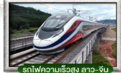
รถไฟความเร็วสูง ลาว-จีน