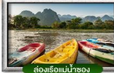
ล่องเรือแม่น้ำซอง