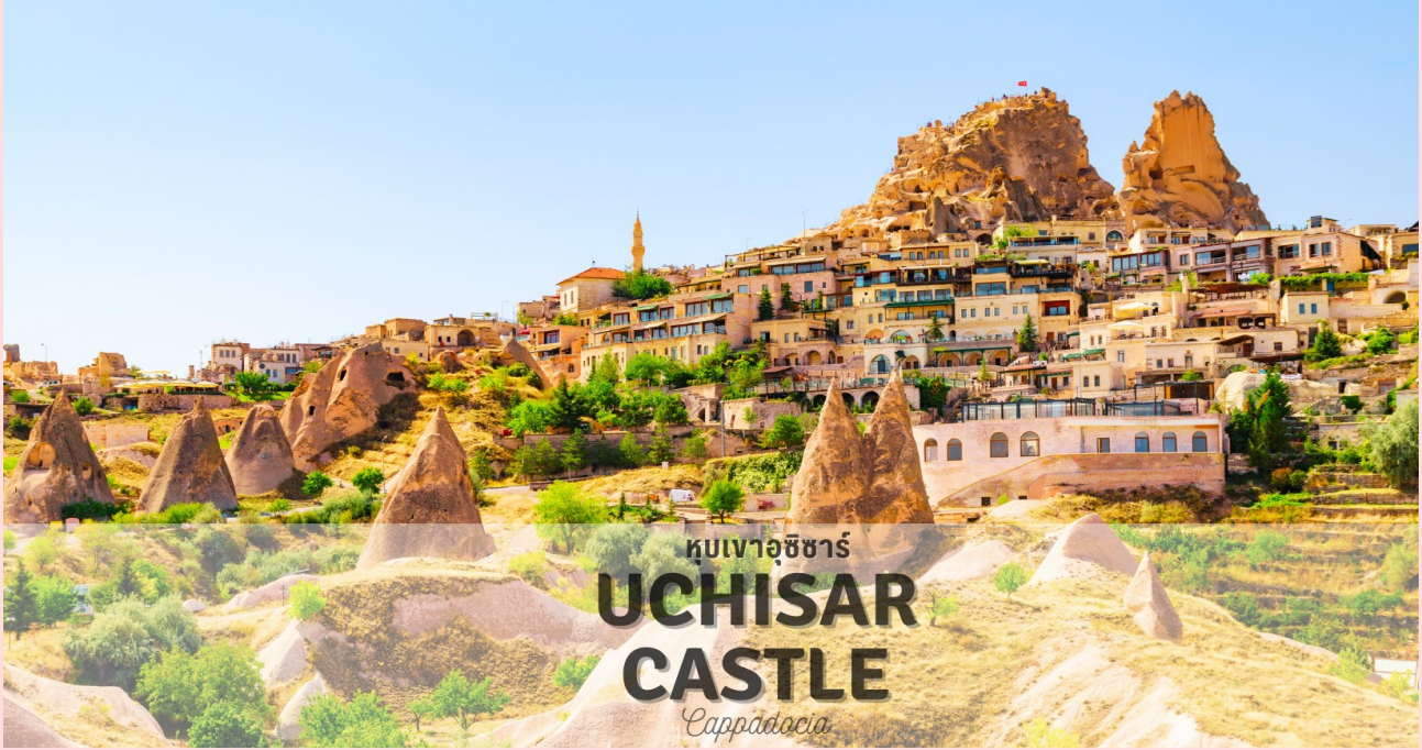
หุบเขาอุชิซาร์ UCHISAR CASTLE Cappadocia

แวะถ่ายรูป หุบเขาอุชิซาร์ (UCHISAR VALLEY) หุบเขาค่ายจอมปลวกขนาดใหญ่ ใช้เป็นที่อยู่อาศัย ซึ่งหุบเขาดังกล่าวมีรูพรุน มีรอยเจาะรอยชุด อันเกิดจากฝีมือมนุษย์ไปเกือบทั่วทั้งภูเขา เพื่อเอาไว้เป็นที่อยู่อาศัย