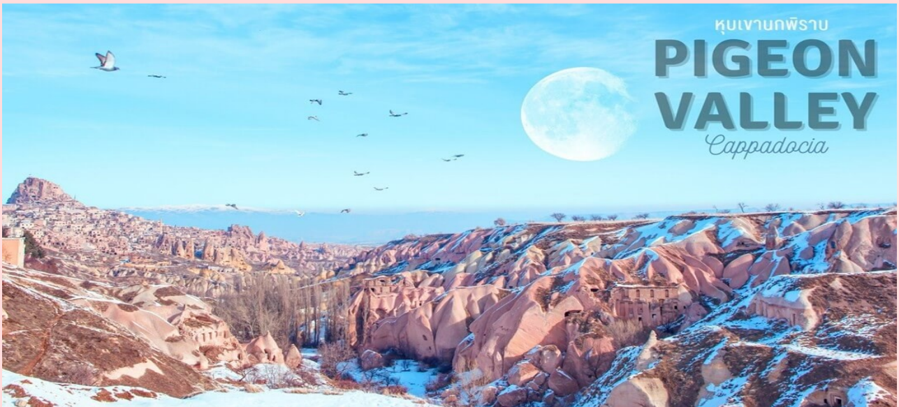
หุบเขานกพิราบ PIGEON VALLEY Cappadocia

นำท่านชม หุบเขานกพิราบ (PIGEON VALLEY) จุดชมวิวยุ่ตรงบริเวณหน้าผาที่ชาวเมืองโบราณได้ขุดเจาะเป็นรู เพื่อให้นกพิราบเข้าไปทำรังอาศัยอยู่ ชาวบ้านเลี้ยงนกพิราบไว้เพื่อนำมูลมาทำเป็นปุ๋ยบำรุงต้นไม้ จากจุดชมวิวสามารถมองเห็นปราสาทอุชิซาร์ (UCHISAR CASTLE) และยังมีต้นไม้จำลองที่เต็มไปด้วยดวงตาสีฟ้าแขวนอยู่โดดเด่น อีสรระถ่ายภาพตามอัธยาศัย