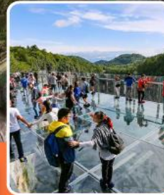
ระเบียงแก้วอุ๋หลง

ภูเขาหว่าอูซาน (รวมขึ้นกระเช้าไป-กลับ)- อุทยานเจานางฟ้า อุทยานหลุมฟ้าสะพานสวรรค์ - ระเบียงแก้วอุ๋หลง - รถไฟฟ้ากะลุดัก หงหยาดัง - วัดเป้ากั๋ว - หลวงพ่อโตเลอซาน - วัดต้าฉือ หมี่แฟนตั๋ยักษ์ ซ้อปปัง ถนนคนเดินซุนซึลู่ ไท่กู๋หลี่