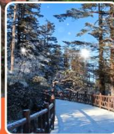
ภูเขาหว่าอูซาน