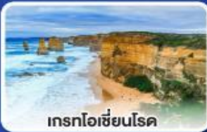
เกรทโอเชียนโรด