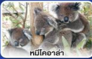
หมีโคอาล่า