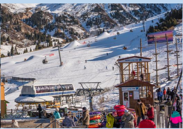
Shymbulak Ski Resort

หมายเหตุ **หิมะจะเริ่มตกในช่วงปลายเดือนพฤศจิกายน-เดือนกุมภาพันธ์** **ช่วงปลายเดือนธันวาคม-มกราคมทั้งเดือน เป็นช่วงที่เหมาะสมกับการเล่นสกีที่สุด**