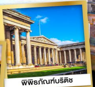
พิพิธภัณฑ์บริติช