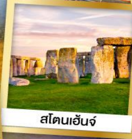
สโตนเฮนจ์