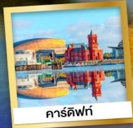
คาร์ดิฟฟ์