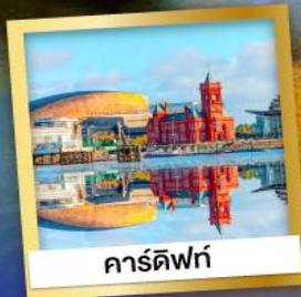
คาร์ดิฟฟ์