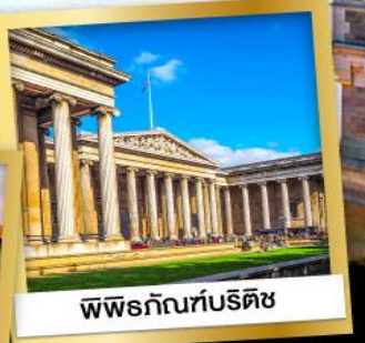
พิพิธภัณฑ์บริติช