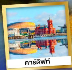
คาร์ดิฟฟ์