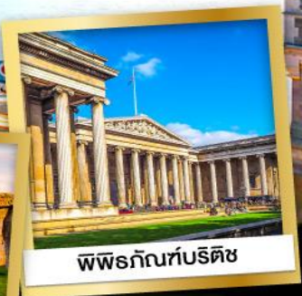
พิพิธภัณฑ์บริติช