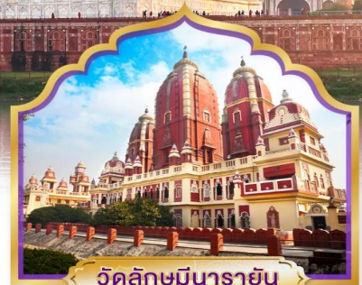
วัดลักษมีนารายณ์