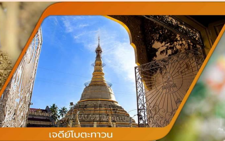
เจดีย์โบตตะกวน