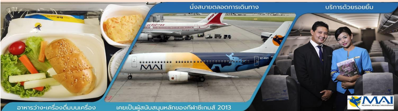
อาหารว่าง+เครื่องดื่มบนเครื่อง