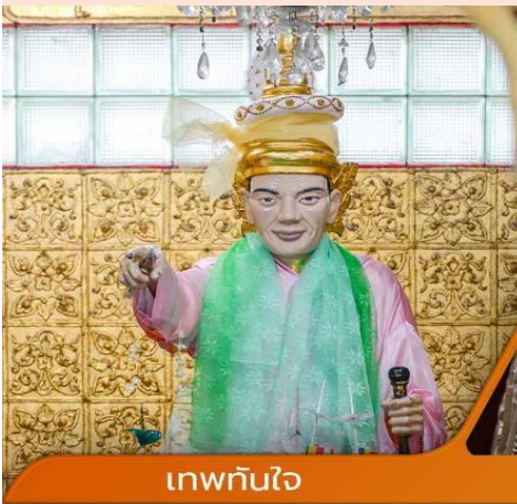
เทพทันใจ

คำบูชาเทพทันใจ เอหิ สักกะ มหานัทโปะโปะจีโปตะต่องสิทธิมัตถุ อิทังพะลัง เอตัสสะมิงรัตตะนัง พุทธัง อัมมัง สังฆัง เทวานัง ประสิทธิลาภ โขโยนิจจัน วันทามิสัพพะทา สวาโหม